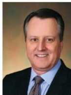
Charlie Arnot , CEO, The Center for Food Integrity (US)